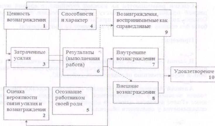
Рис. 6. Схема теории мотивации Портера-Лоулера